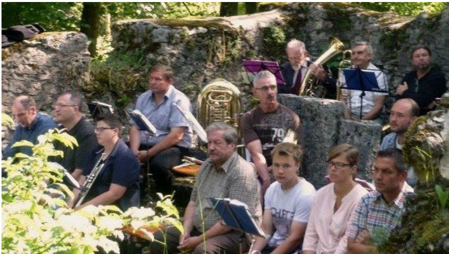
Dietersberg: gemeinsamer Pfingst-Gottesdienst mit Eglolfstein