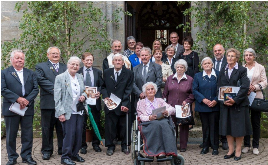
Jubiläum-Konfirmation am Pfingst-Montag