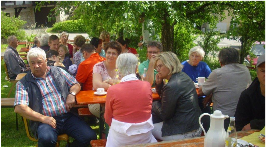
Gemeindefest rund um die „Alte Schule“