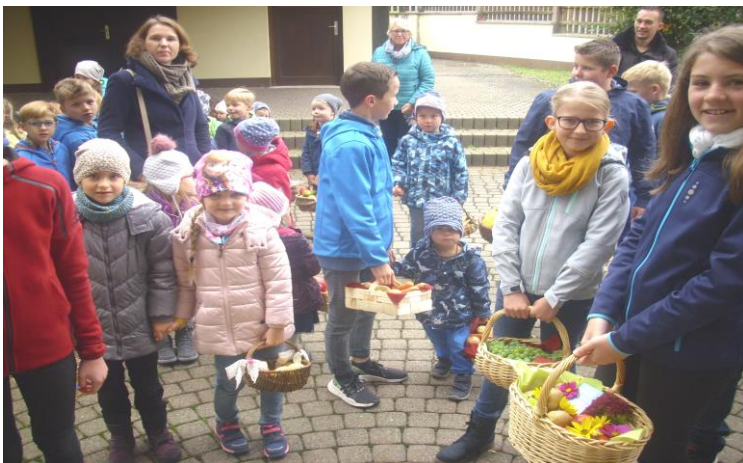
Kinder vor dem Einzug in die Kirche am Erntedankfest

Und natürlich kommt die Gemeinschaft und der Spass bei uns nicht zu kurz. Auskunft bekommt ihr bei jedem Posaunenchorbläser. In Kürze findet ein Kennlern- und Schnupperabend in der alten Schule statt. Wir freuen uns auf DICH.